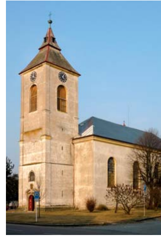
Kostel Nanebevzetí Panny Marie

Die Stadt Nechanice liegt in der Mitte der Verbindung zwischen Nový Bydžov und der Bezirksstadt Hradec Králové. Sie wird vom Fluss Bystřice umflossen. Zu Nechanice gehören sechs Ortsteile - Lubno, Nerošov, Sobětuš, Staré Nechanice, Suchá, Tůně und die Siedlung Komárov. Gegenwärtig leben hier 2 306 Einwohner.